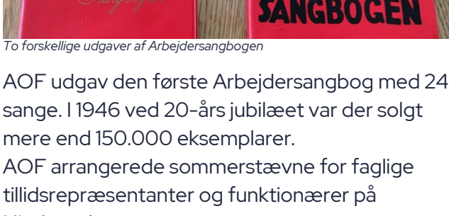
To forskellige udgaver af Arbejdersangbogen

AOF udgav den første Arbejdersangbog med 245 sange. I 1946 ved 20-års jubilæet var der solgt mere end 150.000 eksemplarer. AOF arrangerede sommerstævne for faglige tillidsrepræsentanter og funktionærer på Hindsgavl.